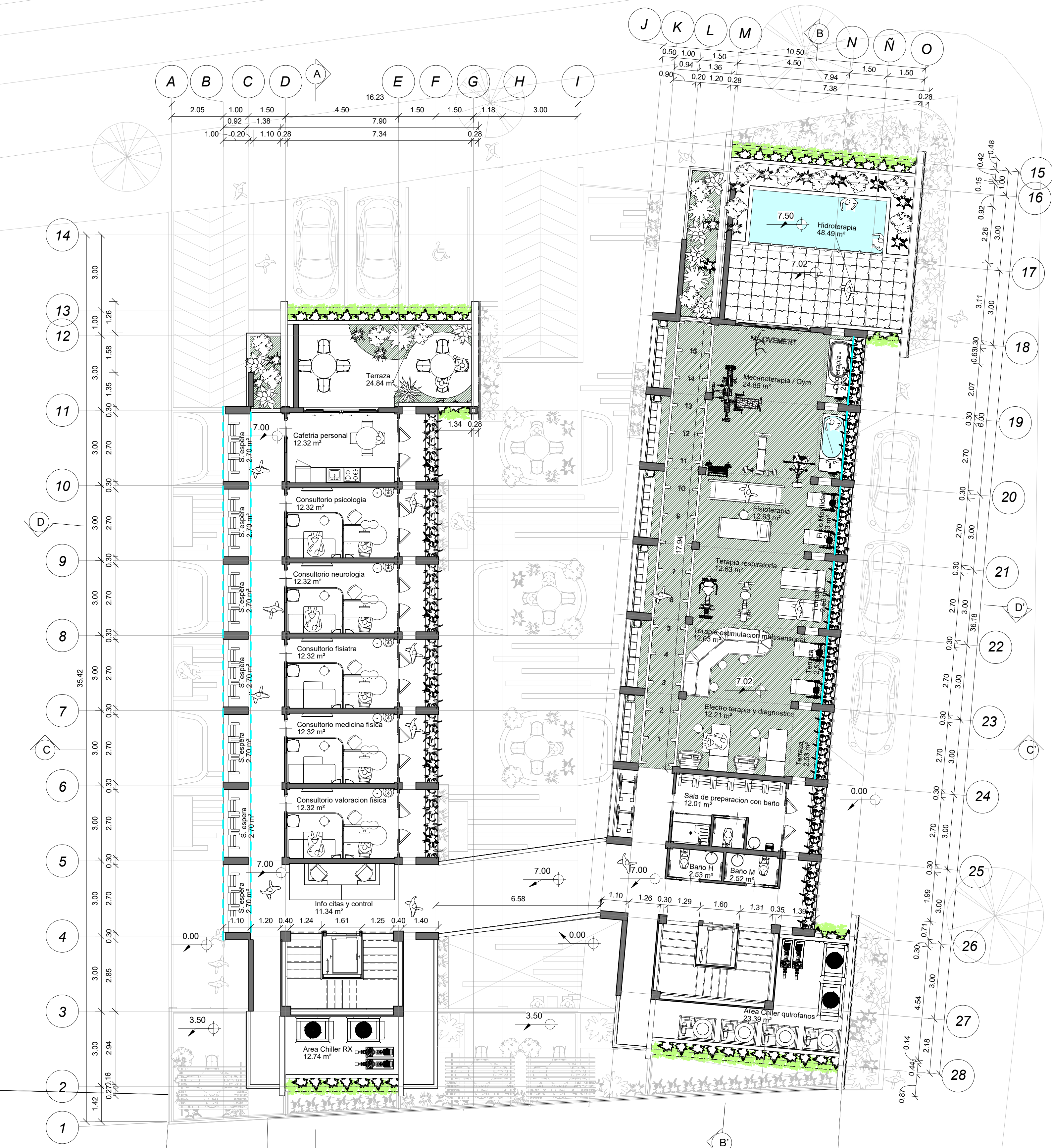
1 Nivel 3 +7.0 1:100